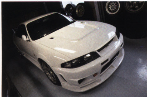
お宝発見! ガレージにはスペシャルGT-RのNISMO 400Rも在庫。GT-Rファンにとっては秘密基地のような存在だ