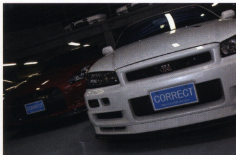
「正直・誠実」をモットーに程度のよい中古GT-Rを専門に扱う「コレクト」。個人オーナーからいいものを仕入れている