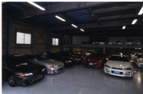
ガレージには常時20台程度のGT-Rがズラリと並ぶ。整備記録簿のしっかりしたワンオーナーカーを多く揃えている